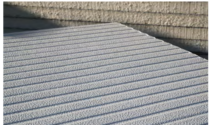
Supporto standard goffato che imita l'intonaco finito.

Thanks to the perfect configuration of the interlocking joint, in addition to a pleasant and uniform surface of the envelope construction, the panel is able to pull down considerably the thermal bridges which, as it is known, are the cause of energy losses and condensation.